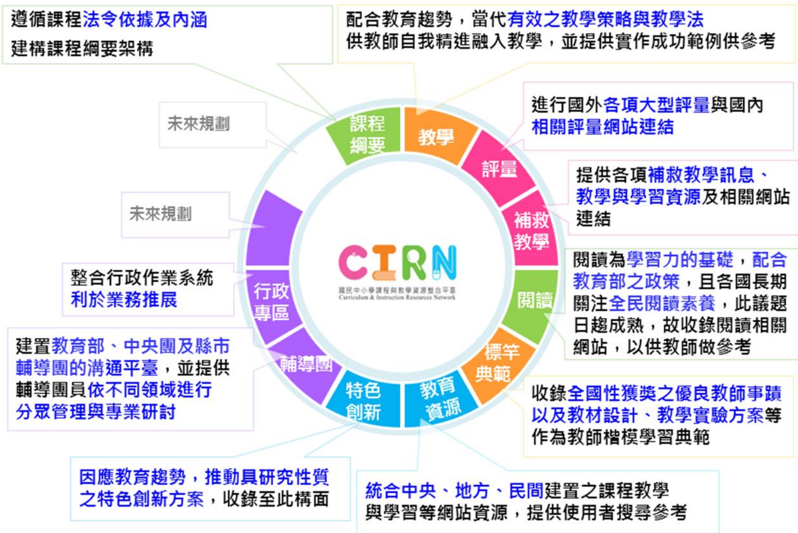
▲「國民中小學課程與教學資源整合平臺 CIRN」十大構面理念